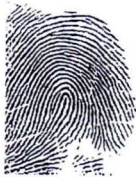
Ngón trỏ trái Left index finger