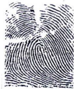
Ngón trỏ phải Right index finger